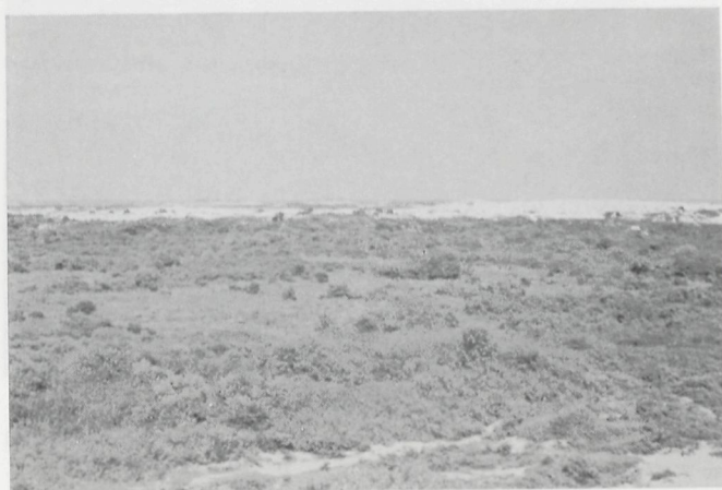
Fig. 8: Het weilandgedeelte in de zuidelijke pannengordel. Foto genomen vanop de zuidelijke paraboolduin. Op de achtergrond de witte massa van het centrale wandelduin.

excelsior ), gelderse roos ( Viburnum opulus ), kruisbes ( Ribes uva-crispa ) en een verwilderde kardinaalsmuts ( Euonymus europaeus ) aan. In de ondergroei, in opener, relatief droog terrein domineert nogal eens duinriet ( Calamagrostis epigeios ), soms vergezeld door addertong ( Ophioglossum vulgatum ). Vochtiger gedeelten worden gekenmerkt door kattestaart ( Lythrum salicaria ), harig wilgeroosje ( Epilobium hirsutum ), kale jonker ( Cirsium palustre ), moeraswederik ( Lysimachia vulgaris ), leverkruid ( Eupatoria cannabinum ), valeriaan ( Valeriana repens ), wolfspoot ( Lycopus europaeus ), watermunt ( Mentha aquatica ), moeraswalstro