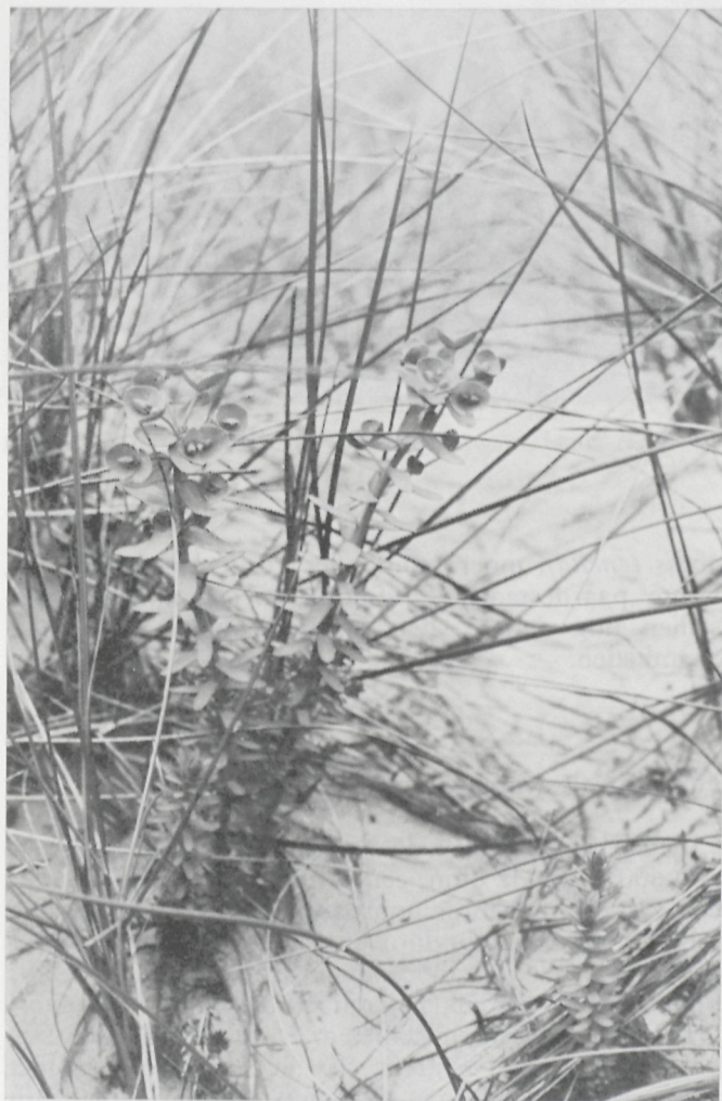
Fig. 2 : Zeewolfsmelk ( Euphorbia paralias ) in de zeereep.

wegingen en gedreven door een niet te stuiten ijver, een niet opvallende dam aangelegd (hoogte 1,5 m, breedte aan de basis 3 m) met brokstukken van de kort tevoren geruimde bunkerrestanten uit de zeereep. Over de biologische konsekwenties van de zeedoorbraken en over het opportune van de aanleg van voornoemde dam werden in de advies-beheerskommissie van het reservaat ettelijke woorden gewisseld. Hoewel een kunstmatige versterking van de duinvoet wellicht