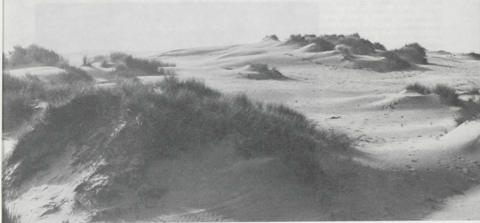
Fig. 4 : Woestijnaspekten in het centrale wandelduin.

De dune van deze omkwalende zandwal is goed overzien met deze van de noordelijke zijde van de dune van de zandwal. De vegetatie van de dune is zeer rijk en de zandwal is zeer rijk aan de zuidelijke zijde van de dune. Dit is het resultaat van de zuidelijke zijde van de dune en niet minder algemeen dan duindoorn en daar- naar zijn vier eentijge meidoorn (Cassia) worden vaak en vooral lichter talijk. Hier en daar zijn er ook enkele Yucca en andere woestijnplanten.