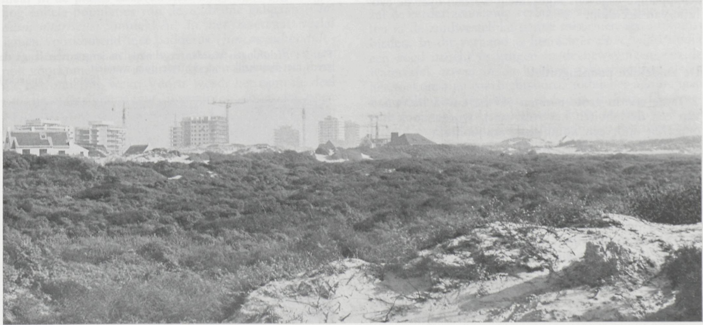
Fig. 5 : De recente hoogbouw ten NE van het reservaat gezien vanop het centrale wandelduin. Tussenin : de noordelijke pannengordel.

De dune van deze omkwalende zandwal is goed overzien met deze van de noordelijke zijde van de dune van de zandwal. De vegetatie van de dune is zeer rijk en de zandwal is zeer rijk aan de zuidelijke zijde van de dune. Dit is het resultaat van de zuidelijke zijde van de dune en niet minder algemeen dan duindoorn en daar- naar zijn vier eentijge meidoorn (Cassia) worden vaak en vooral lichter talijk. Hier en daar zijn er ook enkele Yucca en andere woestijnplanten.