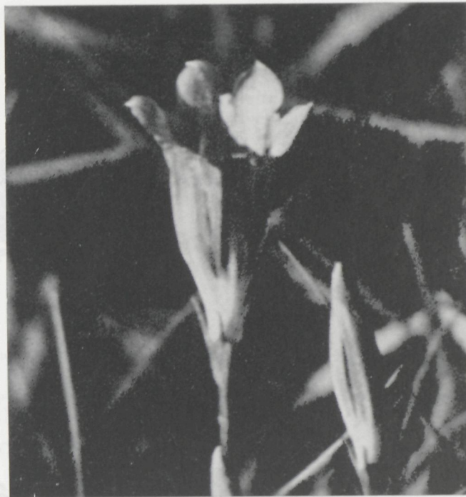
Klokjesgentiaan ( Gentiana pneumonanthe ).

De aanslagen op onze natuur en 't reservaat kennen geen ophouden. Soms voelt men zich onmachtig en moedeloos. Een vleesbedrijf verpest de nog heldere toevoerbeek, onwettige bouw is op z'n minst een aantasting van het landschap. Sluikstorten en watervervuiling grijpen met inktvisachtige armen om zich heen. Doch het wonder van de natuur in al haar eenvoud en de opdracht die je hebt tegenover de gemeenschap verplichten je verder te strijden tegen het materialistisch egoïsme van de belagers van de natuur. We zullen verder blijven vechten al was het maar opdat de kinderen van onze kinderen nog kunnen zeggen hoe schoon de natuur in De Maten en de Kempen toch is.