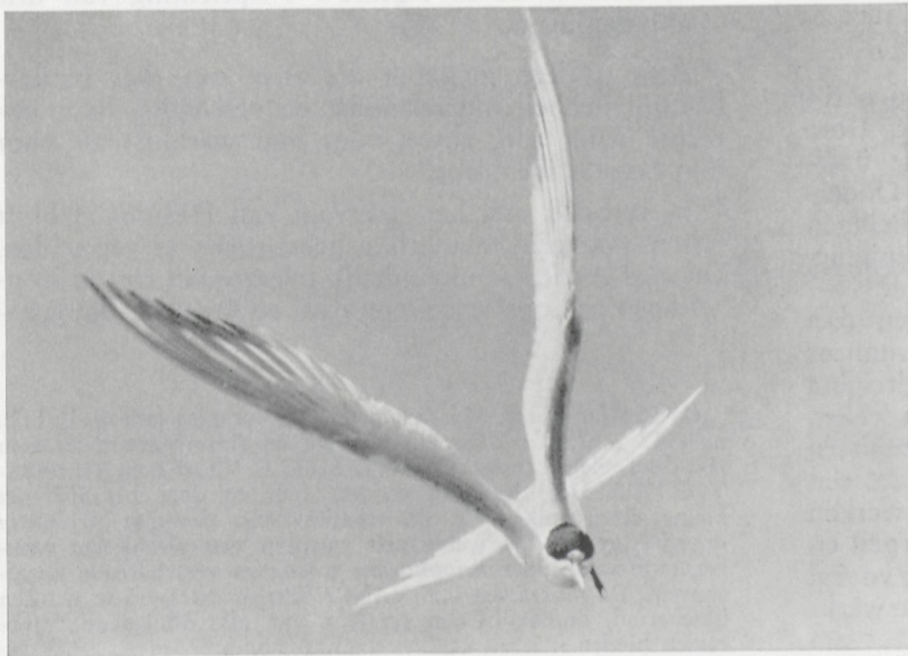
Visdiefje ( Sterna hirundo ).