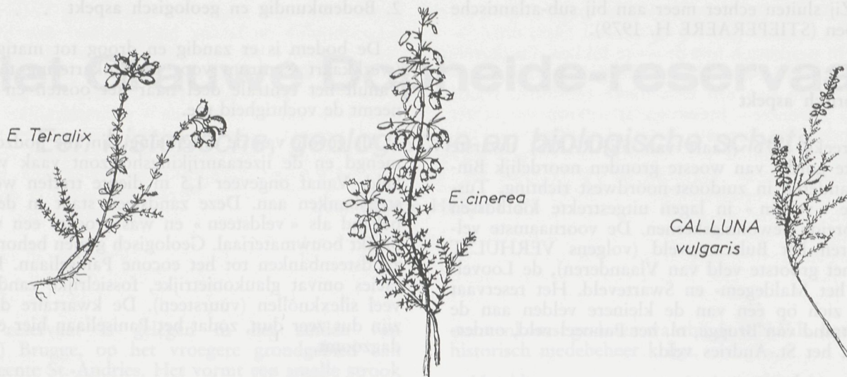
De drie inlandse heidesoorten.

koloniseert het meest efficiënt de intermediaire omstandigheden tussen nat en droog, en de 2 andere soorten worden dus gedwongen te groeien bij de uitersten van de ecologische amplitude van Calluna , daar waar ze op grond van hun fysiologische eigenschappen kunnen wedijveren met Calluna ... De gevoeligheid van Erica cinerea voor overstroming en E. tetralix voor droogte zou de eerste uitsluiten uit natte omstandigheden en de laatste uit de drogere minerale bodems.