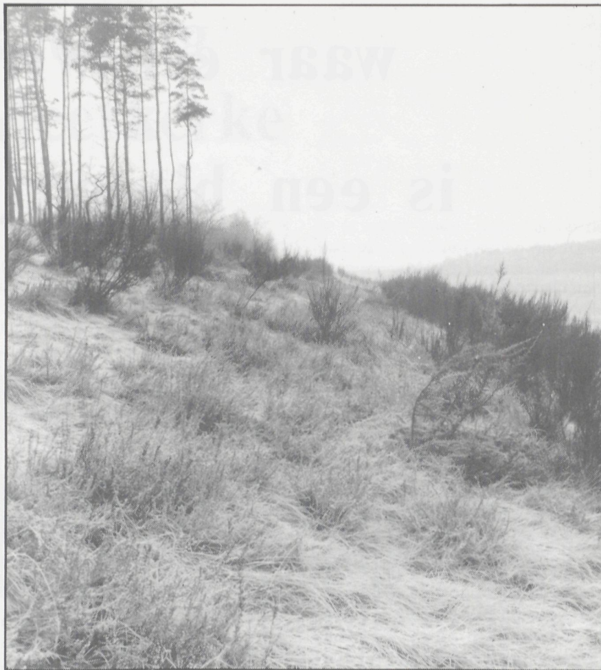
De E3-autostrade bermen te Waasmunster.

In een kultuurlandschap zijn veel insectensoorten voor hun voortbestaan aangewezen op de begroeiing van de wegbermen. Niet alleen bloembezoevende insecten zoals vlinders, hommels en wilde bijen, maar eveneens een aantal insecten die in hun larvaal stadium aan specifieke planten gebonden zijn, vinden hier hun gading. Zo komt de rups van onze mooiste