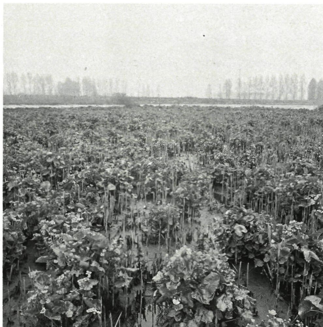
Bloeiende Dotterbloemen in de Rietsnijderij