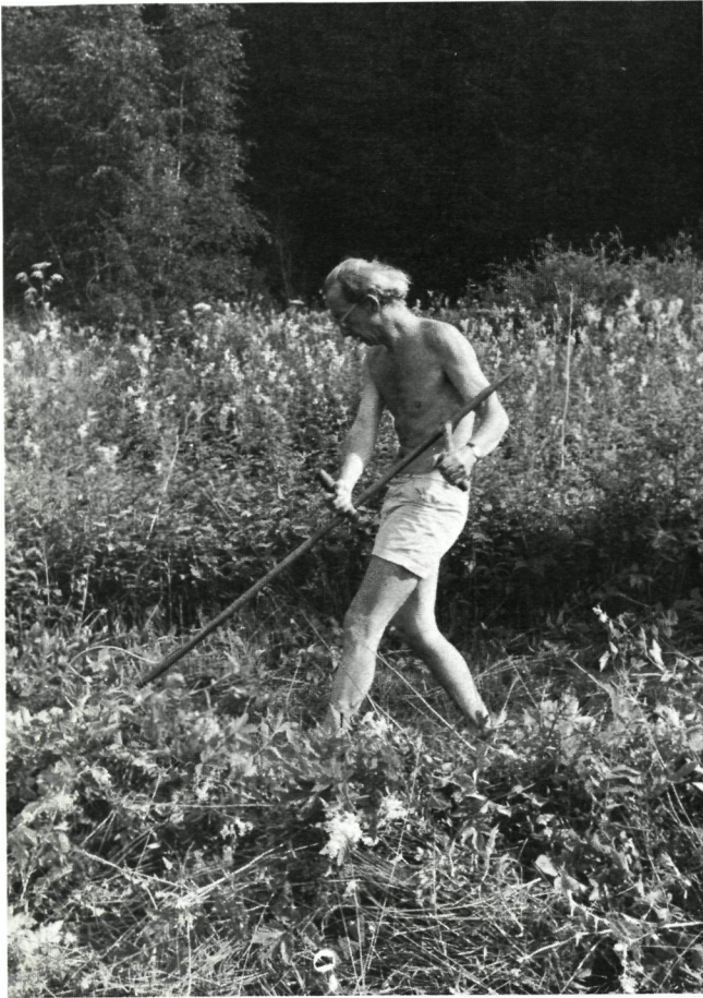
...en zo gebeurt het nu :

Ook branden kwamen in deze bijzonder ontvlambare gebieden niet zelden voor, vooral tijdens tamelijk droge periodes.