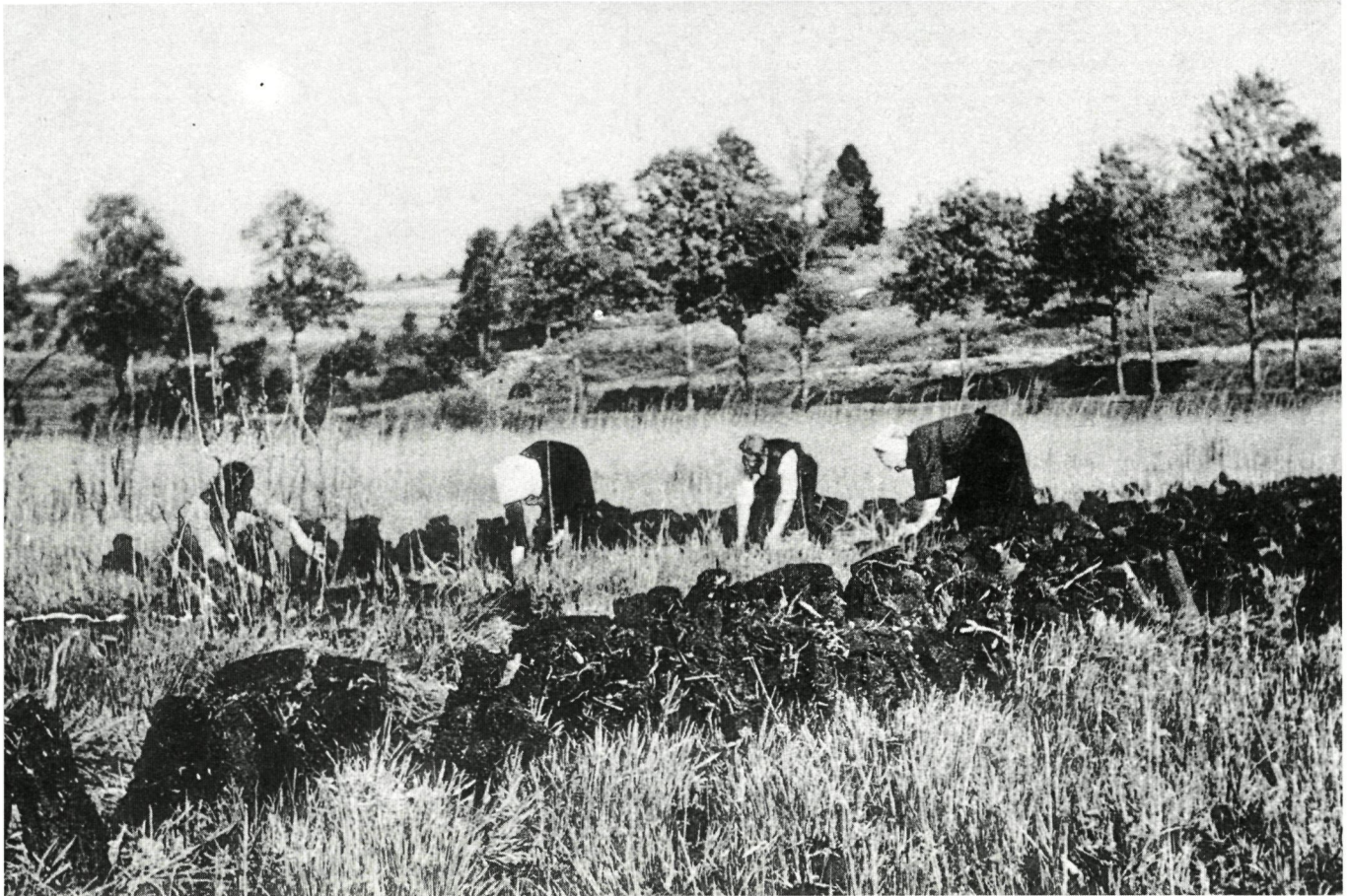
Zo gebeurde het vroeger: om den brode...

doen stijgen. De kwaliteit van het water is een ander belangrijk punt, want een bevoeiing met niet-voedselarm water zou catastrofaal zijn.