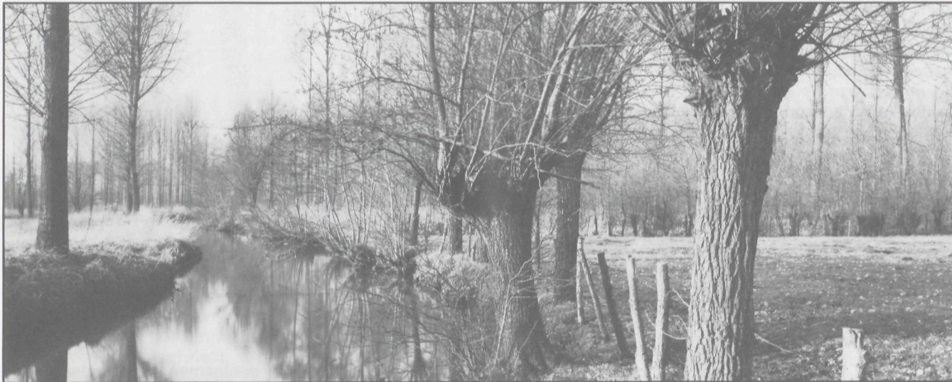
De Marcke te Galmaarden