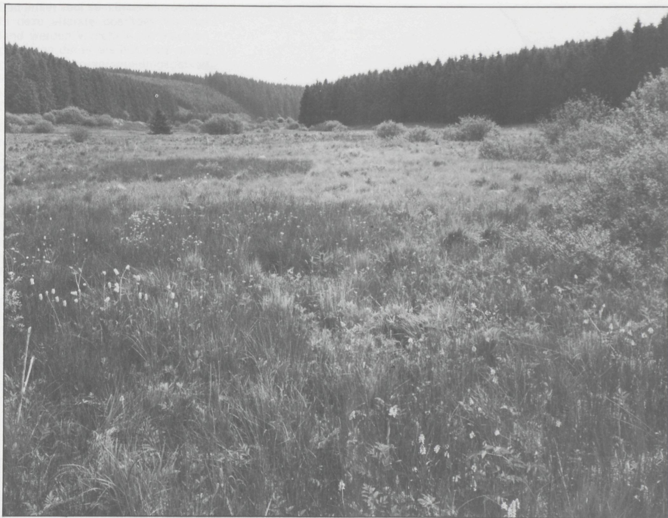
Voorjaarsaspect van de vallei van de Holzwarche met op de voorgrond Adderwortel en Gevlekte Orchis in bloei. De donkerder stukken liggen lager en bestaan vooral uit Waterdrieblad en verschillende Zeggen en Russen.

Deze bevoelde hooilanden spreiden een uitzonderlijk rijke plantengroei ten toon, met een aantal Midden-europese kenmerken.