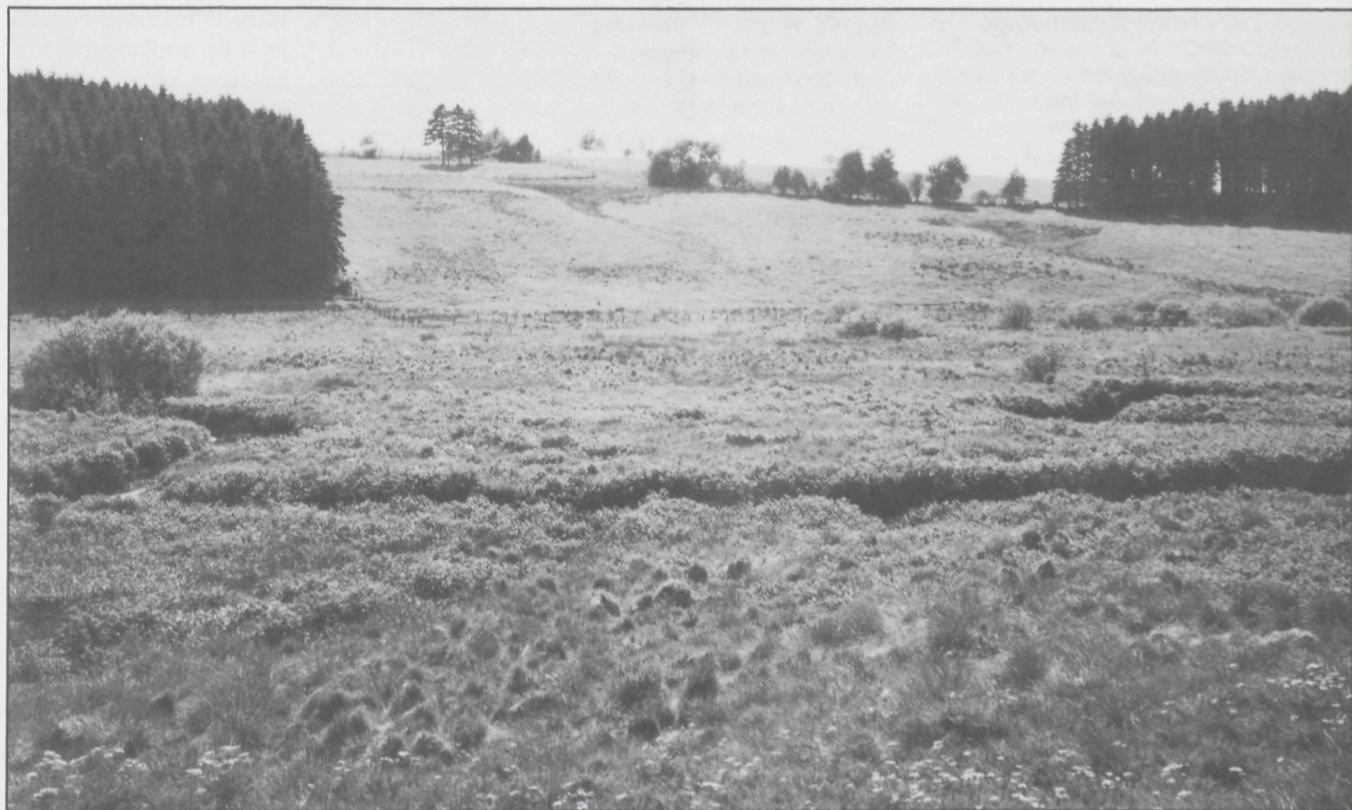
De kronkelende Holzwarche met op de voorgrond massale bloei van Berewortel.