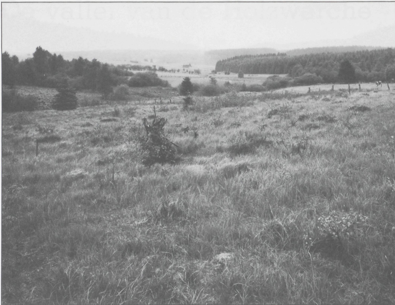
Op de voorgrond een afgesloten meander van de Holzwarche die door veengroei opgevuld wordt. Let op de massale aanwezigheid van Waterdrieblad met enkele bloeiende exemplaren.

Wateraardbei. Beide zijn dit planten die ver van alleदाags geworden zijn. Deze begroeiing kan aaneengroeien tot een trilveen, met Zompzegge op de voedselarme stukjes, en met Dotterbloem en Bosbies op de voedselrijkere plaatsen. Op sommige plaatsen evolueert die verlandingssituatie tot veenmosbegroeiingen met Eenarig Wollegras.