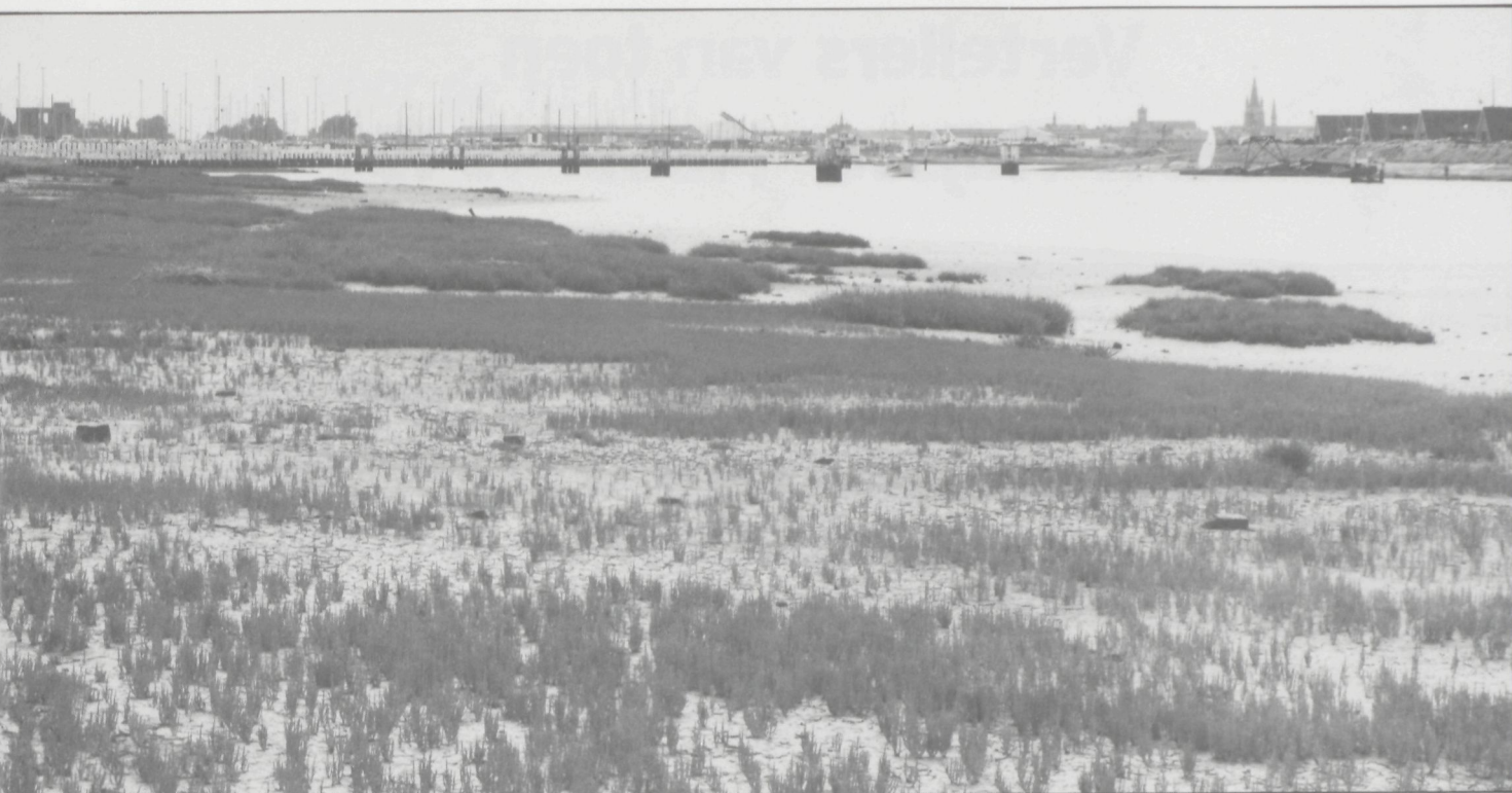
De IJzermunding te Nieuwpoort, 40 ha sinds 1961 door B.N.V.R. beheerd als natuureservaat

kan uiteraard voor veel onderwerpen belangstelling hebben doch natuur en antiek zijn twee dingen waar eigenlijk een soort detectiewerk mee gemoeid is wil men bepaalde problemen achterhalen. Ik denk dus wel dat daar enig verband in ligt in mijn persoonlijke interesse voor die twee dingen.