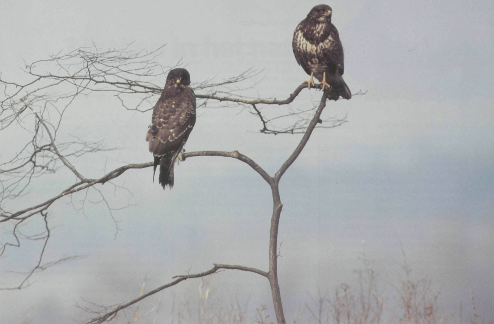
Twee Buizerden op de loer