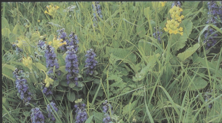
Zenegroen + Sleutelbloem