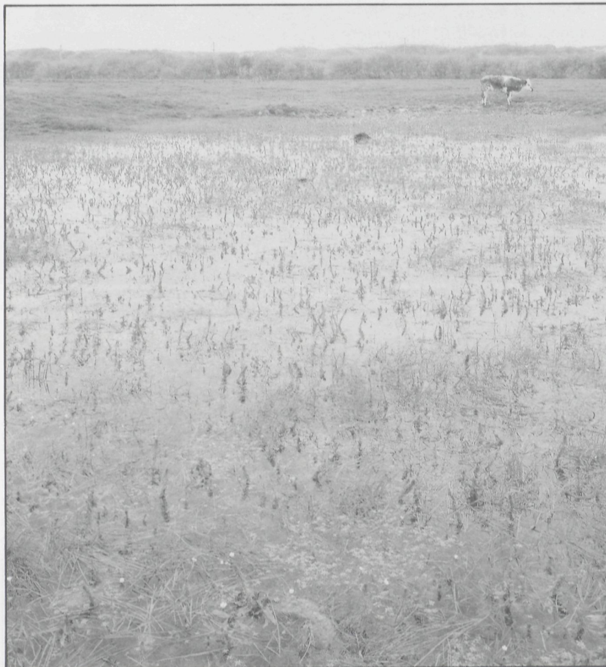
Lidsteng en bloeiende waterranonkels tijdens het vroege voorjaar in een veedrinkplas achter het B.N.V.R.-reservaat 'De Fonteintjes' tussen Blankenberge en Zeebrugge

tels voortbrengen of vormen een soort stengelspruiten en wortels. Dergelijke losdrijvende mini-individueen kunnen terechtkomen in de oeverzone en er verder uitgroeien. Ze ontstaan voornamelijk in de winter en het voorjaar ten