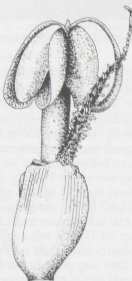
Fig. 1: Volledige bloem van de Lidsteng: vruchtbegin-sel met stijl en meeldraad

niet mis: de Lidsteng, de plant met de gelede stengel. Elke krans bladeren is inderdaad netjes gescheiden door een stukje stengel, een lid, en juist doordat de bladeren telkens in één vlak in kransen bijeen staan, zijn die leden zo duidelijk. Ook de bloemen zijn speciaal. Wie een mooie, welgevormde bloem verwacht aan de top van de stengel komt bedrogen uit. Nee, in de oksel van elk blad groeit een onooglijk knopje uit tot een minuscule, maar volledige bloem: een éénhokkig vruchtbegin-sel met één zaadknop, een penseelvormige, rijk van papillen voorziene stempel en één meeldraad (Fig. 1).