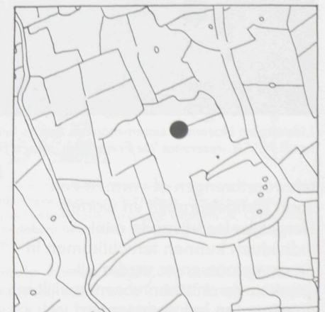
Fig. 4: Voorbeeld van het voorkomen van de Lidsteng binnen één hok van 1 km 2 . Afgebeeld is het patroon van sloten en veedrinkputten. De oppervlakte van de enige groeiplaats is 30 x vergroot