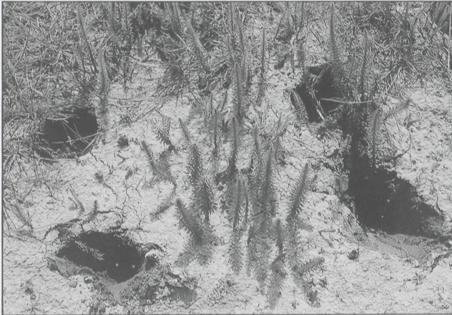
Koeien kunnen Lidstengplantjes bruut vertrappelen. Voor Lidsteng geen erg. Meegevoerd aan de beslijkte poten van het vee kunnen ze op geschikte plekjes terecht komen en nieuwe groeiplaatsen doen ontstaan