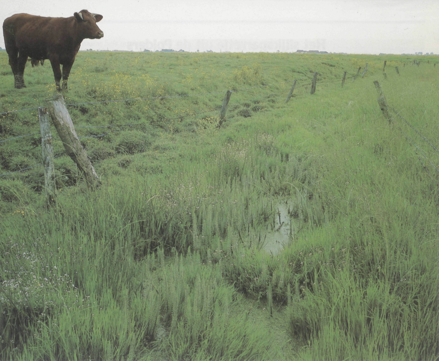
Groeiplaats met Lidsteng te Lampernisse. Het lijkt wel een uit het water opschietend ijl sparrenbosje