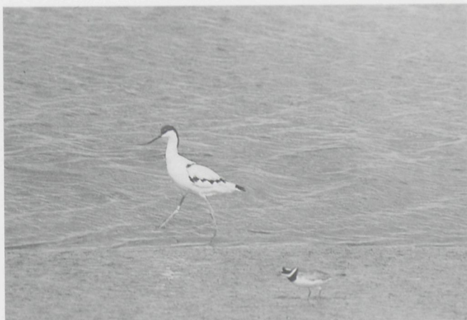
De statige Kluut en het Bontbekpleviertje. Twee disgenoten langs de slikranden van plasjes en sloten in de Ramskapelpolder

onoverkomelijke barrières in de weg; zowel jongen als ouders zijn voortreffelijke stappers als zwemmers. Een dergelijke verhuis hebben we tijdens de zomermaanden van 1982 evenwel niet vastgesteld; wat wijst op het ruime en aanhoudende voedselaanbod in de polderweilanden en -sloten. Mag hierbij aangestipt dat de Kluut het de laatste broedseizoenen steeds meer aandurft rondom geïsoleerde veedrinkputten in de Oostkustpolders te gaan broeden. Hopelijk weet hij hier voor de toekomst enig