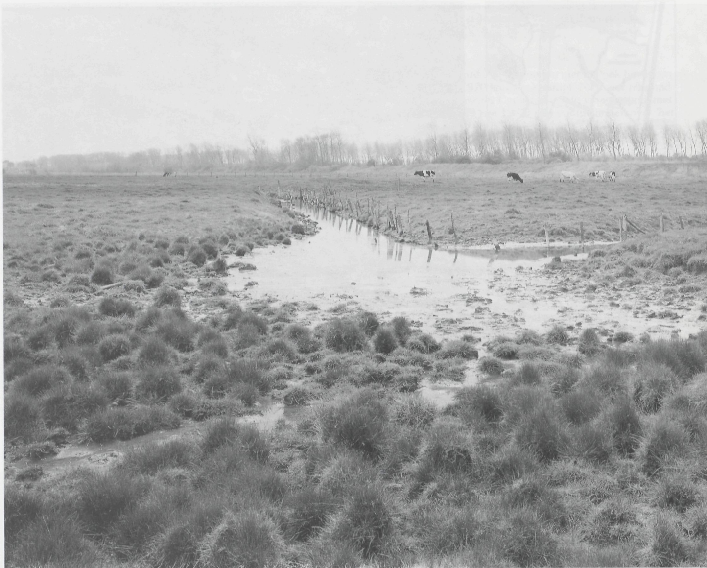
In de weilanden treft men op de natste plekken een wonderlijk micro-reliëf van bulten en pollen

kerktoren van Lissewege is dit zondermeer een van de mooiste panorama's die de Vlaamse kust te bieden geeft. Een natuurreservaatje in de dop dus, ware het niet dat hier straks een zandlaag van 3 m dikte overheen moet.