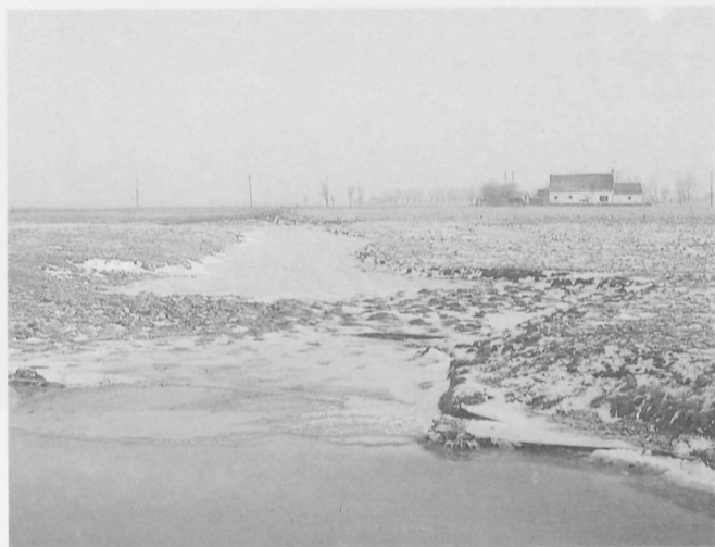
Strooiendorp onder sneeuw en ijs. Woorden schieten hier tekort