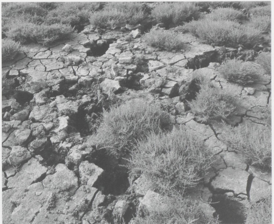
Krimscheuren in een uitgedroogde, slijkerige laagte langs het Boudewijnkanaal. Bemerk de dikke tuilen Zeekraal

Zo te horen zijn de aanpalende weilanden een dorado voor de Tureluur. Evenzo ontdekken we er een nazomers troepje Grutto's, overzomerende Wulpen en een verontrust paartje Bergeenden. Kluten halen de gekste luchtacrobatieën uit om ons weg te lokken. Hun jongen zitten al goed in het verenpak. Deze weg verlaten we tegenaan de beboste oevers van het zee-kanaal. Rechtsaf, en meteen krijgen we een meedogenloze kassei-strook-met-hoge-rug onder de wielen geschoven. Voor de havenwerken kon men hierop zo'n 4,5 km doordokkeren. Vandaag is daar reeds 1,5 km kassei vanaf gepietst. Aan het eenzame café de Overzet kunnen we meerdere kanten uit. Met de veerpont (één van de laatste in Vlaanderen) kan desgewenst het 70 m brede zee-kanaal overgevaren maar we nemen een scherpe bocht om de herberg heen en de Onze-Lieve-Vrouweader in. Deze weg is niet geasfalteerd en het landschapsbeeld noopt al meteen eventjes de rit te onderbreken. Naar de