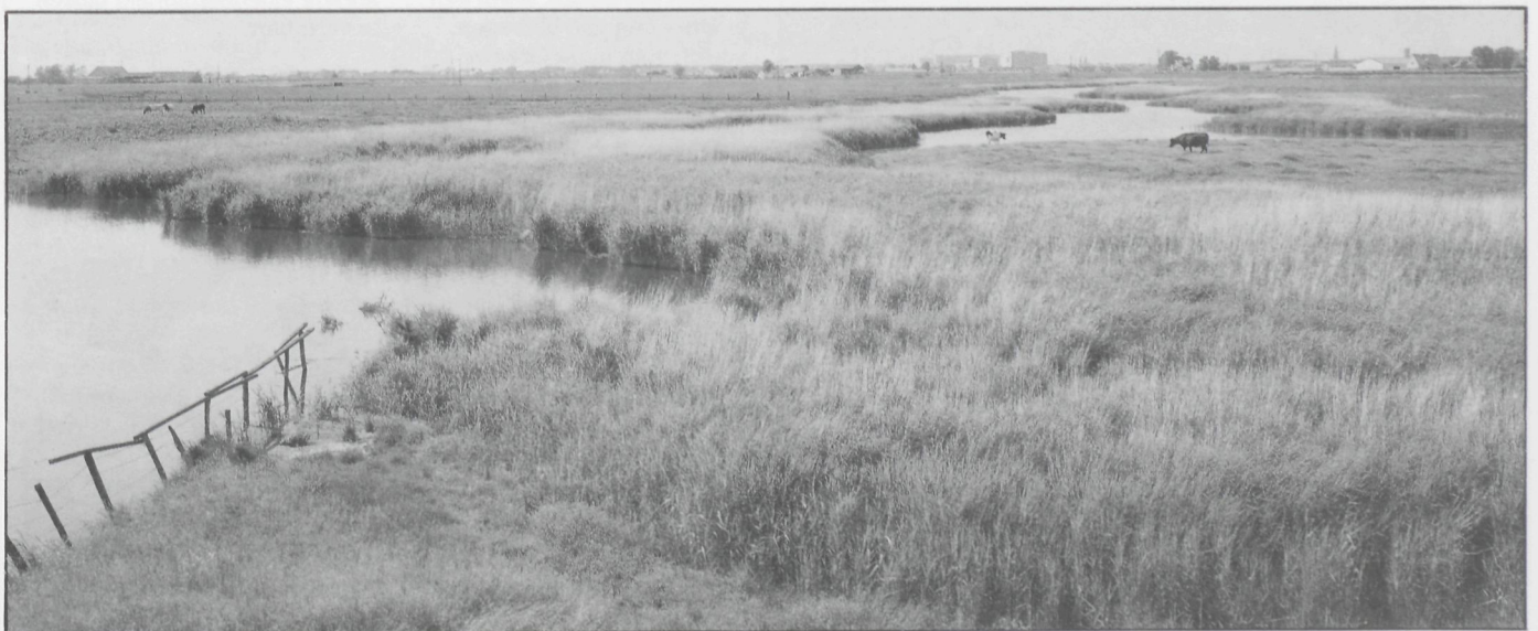
Een prachtig natuurgebied, de Zoutekreek nabij Zandvoorde. Op de achtergrond Oostende

Eind 1980 werden in opdracht van het Oostends stadsbestuur werken aangevat voor 'recreatieve ontsluiting'. Rietkragen werden het water ingeduid, oevers werden met azobehout versterkt, een twee tot drie meter breed pad werd tegen de waterkant aangelegd, de natuurlijke vegetatie werd de grond ingeplougd, gras werd ingezaaid en sierheesters besteld. Ook zou een zestig meter lange steiger met zitbanken en verlichting ver in het water lopen en voor een breed panorama moeten zorgen. Een schrijnende ingreep voor meer 'groen'. Het spel werd hierbij grof gespeeld, want degenen die tegen deze gang van zaken opkwamen, werden keer op keer met een kluitje in het riet gestuurd, terwijl