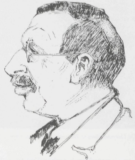
Jac. P. Thysse