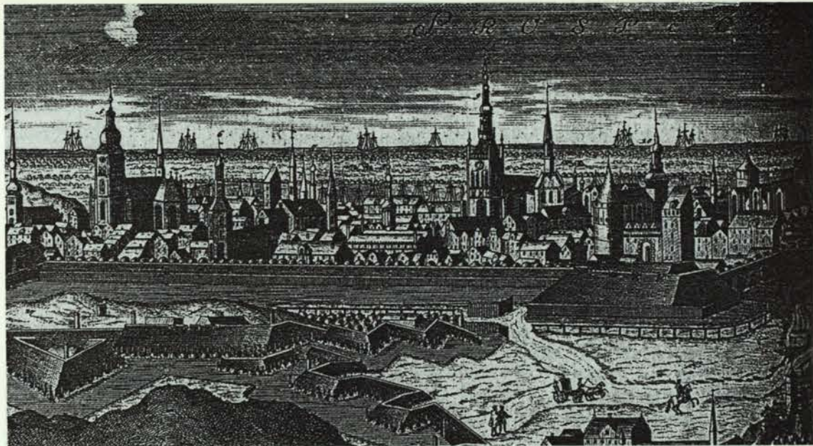
Gezicht op Danzig, 1739 (fragment van een kaart van Danzig en omgeving).

verklaard kan worden door een heenreis in het vorige jaar of een terugreis in het volgende jaar, maar wellicht ook te wijten zou kunnen zijn aan onnauwkeurigheid van de Deense tolambtenaren. 10 In het register zijn immers wel eens vaker slordigheden waar te nemen: verbeteringen, een nummer dat twee keer voorkomt of juist vergeten is, en dergelijke meer. 11 Ook staan Nederlandse schippers veelvuldig genoteerd tussen buitenlandse collega's. 12 Bij het bestuderen van de jaren 1688 en 1693 is steeds dezelfde methode gevolgd. Opvallend is dat in 1688 tussen de Nederlanders een groep buitenlanders staat, die voor het merendeel afkomstig is uit Emden en Bremen. 13 In 1693 is iets soortgelijks aan de hand, maar nu zijn de buitenlanders vooral afkomstig uit Stade, Oldenburg en Kopenhagen. 14 Van de vele 'tegenstrijdigheden' rond de herkomst van de schippers zijn nog diverse voorbeelden te geven. Bij Anne Cornelissen uit Terschelling bijvoorbeeld staat vermeld dat hij voor de Deense IJslandse Compagnie voer, doch hij staat wel tussen de andere Nederlanders genoteerd. Een drietal andere Nederlan-