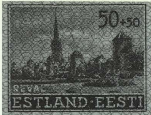
Estse postzegel uit het interbellum met gezicht op Reval.

anderden. Aldus kan een deel van de afname van de Nederlandse en de toename van de Scandinavische en neutrale passages door de Sont worden verklaard. In die zin is dit verschijnsel wellicht van belang voor de gaande discussie over de economische ontwikkeling van de Republiek aan het einde van de zeventiende eeuw. Zo signaleerde J.A. Faber een achteruitgang van de graanaanvoer uit het Oostzeegebied in de tweede helft van de zeventiende eeuw. Hij concludeert onder meer 'dat het relatieve aandeel van de Nederlanders in de Sontvaart verminderde ... en het ligt dan ook voor de hand dat wanneer die graanaanvoer daalt, dat vooral zijn neerslag vindt in het Nederlandse aandeel in het geheel van de Sontvaart'. 65 Uit publikaties van F. Snapper blijkt echter dat, zeker gedurende de Negenjarige Oorlog, de Amsterdamse graanimport niet afnam. 66 Gezien de 'overstap' van veel Nederlandse schippers naar een Baltische stad zou dit verschijnsel mede een verklaring kunnen zijn zowel voor de terugloop van het aandeel van de Republiek in de Sontvaart als het tegelijkertijd constant blijven van de Amsterdamse graanimport.