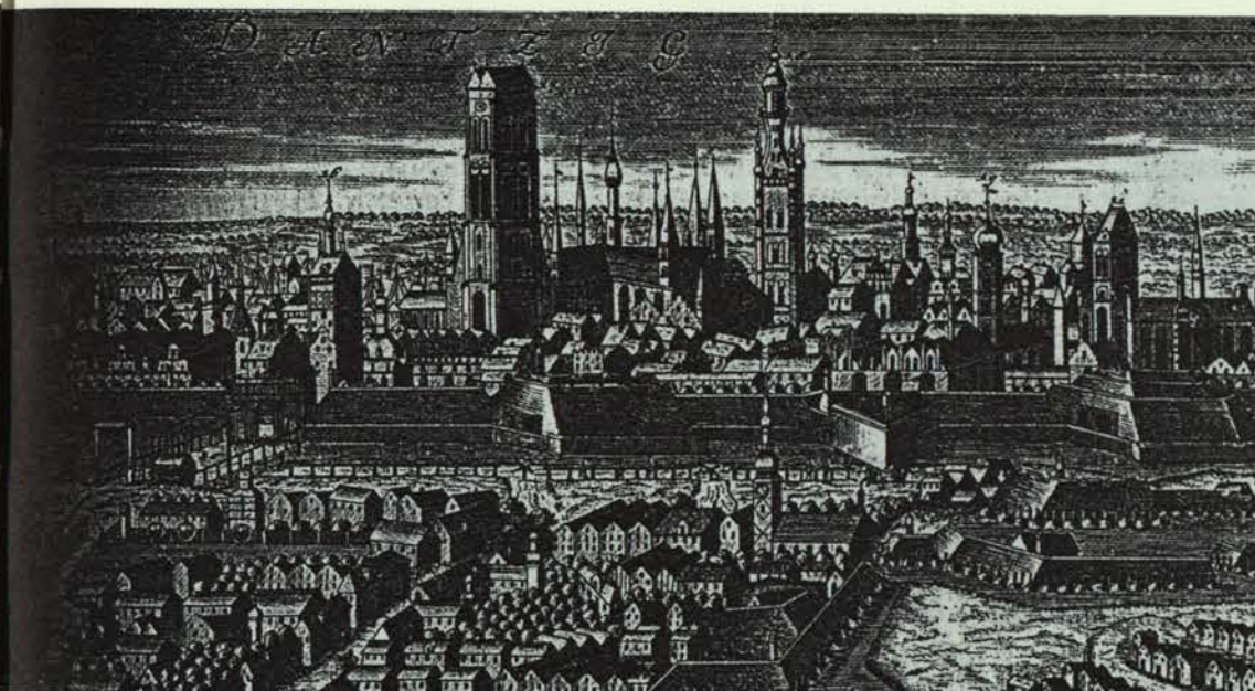
Foto en collectie: Algemeen Rijksarchief 's-Gravenhage, cat.nr. OBPV 1.135.

ders is daarentegen tussen de Denen genoteerd, ofschoon zij in dienst waren van dezelfde compagnie. 15 Een ander voorbeeld is de op een Danziger schip varende Jan Willemsen de Man, geboren te Vlaardingens. In 1688 staat hij twee maal vermeld bij de Nederlanders en éénmaal bij de Noordduitsers. 16 Afgezien van deze foutjes of, beter gezegd, onvolkomenheden in het bronnenmateriaal, gaan we over het geheel genomen ervan uit dat de 'hjemsted' de woonplaats van de schipper is. Onduidelijkheden rond de indeling naar nationaliteit kan veroorzaakt zijn door een latere indeling volgens dit criterium. Een andere versie van de STR uit 1688 is namelijk volledig chronologisch geordend volgens de datum van passeren door de Sont, wat zou kunnen betekenen dat het rangschikken naar nationaliteit pas enige tijd later zou hebben plaatsgevonden. 17 De buitenlanders die tussen de Nederlandse schippers werden ingeschreven zijn grofweg in te delen in drie categorieën. Peter (Lorentz) Reuter uit Windau voer in alle drie hier onderzochte jaren door de Sont. Hij werd meestal tot