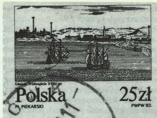
Poolse postzegel van 25 zloty waarop een zeventiende-eeuws gezicht op Danzig.

Tevens zou het verschijnsel wellicht uitkomst kunnen bieden in de discussie over de ontwikkeling van de Noordhollandse scheepvaart als bron van werkgelegenheid in de loop van de zeventiende eeuw. 'Op basis van de