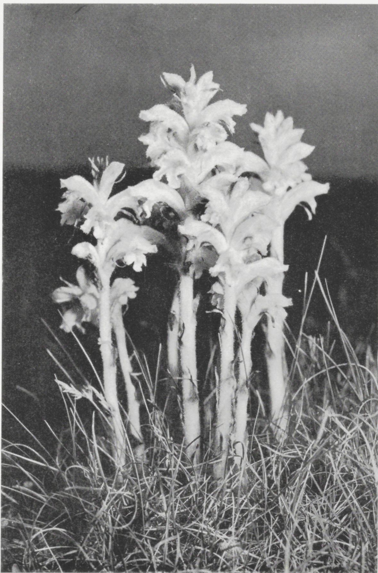
Een Bremraap uit het Zwin.

De ooievaars beginnen rond te vliegen, er werd zelfs één onzer ooievaars in Duitsland teruggevangen.