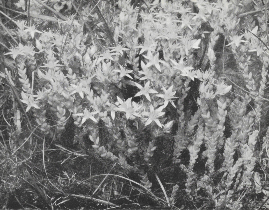
Sedum acre - muurpeper.