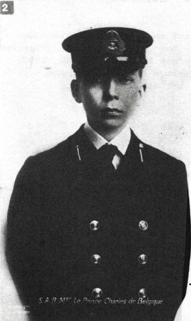
S.A.R. M te Le Prince Charles de Belgique