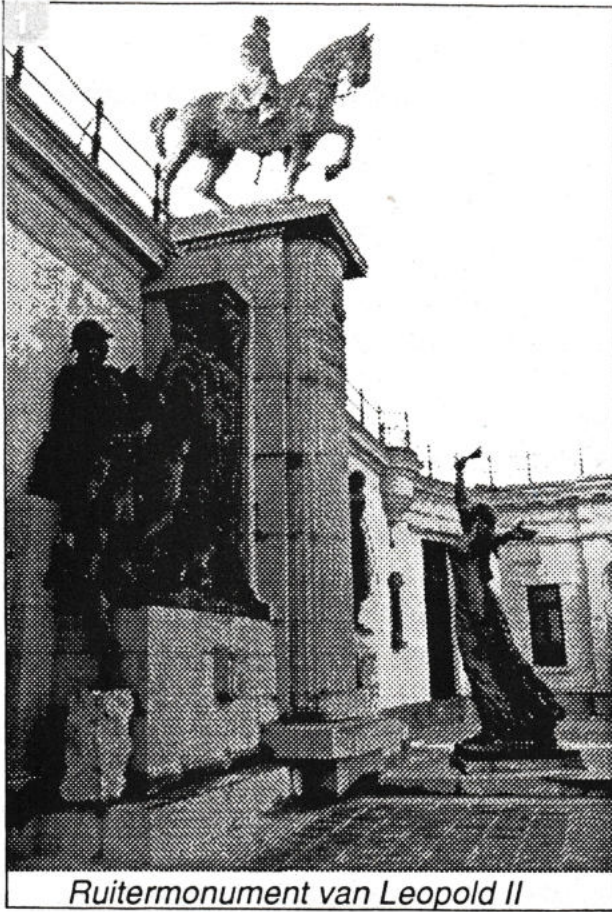
Ruitermonument van Leopold II