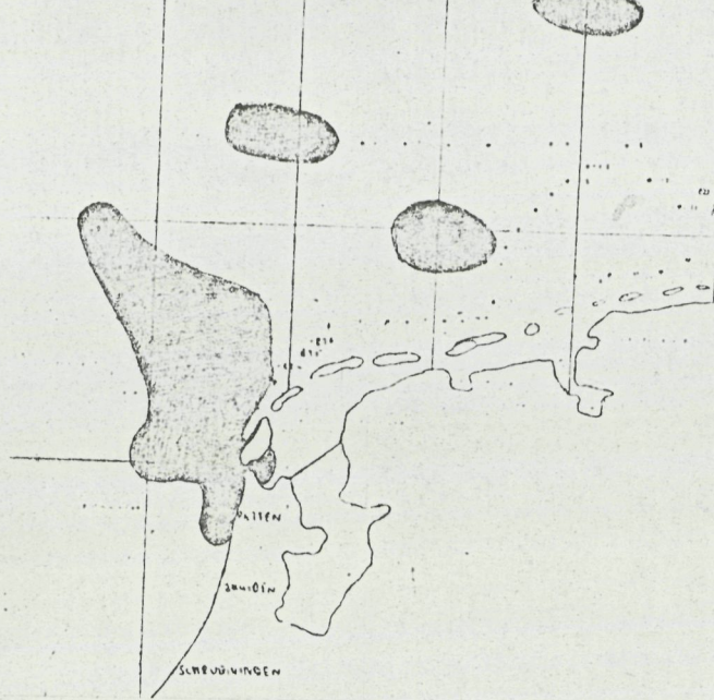
fig. 1. Visserijgebied van de Helderse vissersvloot in 1968.