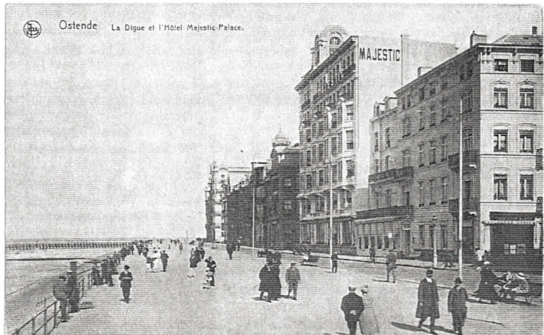
Het Majestic Hotel, één van de palaces van Oostende, bevond zich op de hoek van de Louisastraat en de Albert I Promenade.

Aan het jaar ‘30 heb ik nog mooie herinneringen, want ik herinner mij de grote stoet in Oostende die ingericht werd naar aanleiding van het 100-jarig bestaan van de onafhankelijkheid van België. De stoet kostte veel geld en werd ingericht door de stad in samenwerking met het kursaal. De optocht ging enkel door de Leopold II-laan, nl. van het kursaal naar “De Hof” en van “De Hof” naar het kursaal en dit meerdere keren. Het was de tijd dat de laatste typische “corso’s fleuris” plaatsgrepen. De straten lagen vol bestrooid met bloemen. Voor mij was het als in een sprookje.