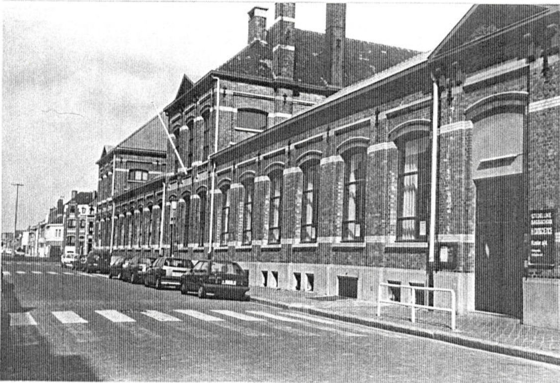
De Consciensschool, gebouwd naar de plannen van de Oostendse stadsingenieur A. VERRAERT, opende zijn deuren in 1909. In mei 1940 werd de school door Duitse stuka's geteisterd.

Wij mochten zelfs niet gelijk waar in "De Blok" spelen. Het hing af van de kant waar je woonde.