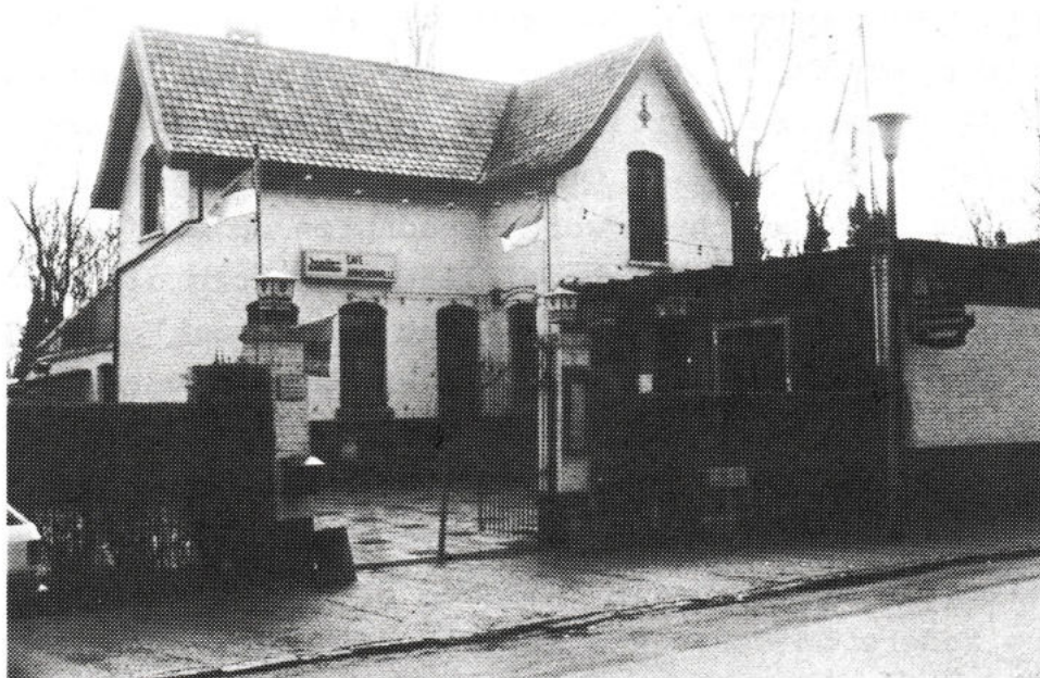
De Armenonville, gelegen in het Maria-Hendrikapark, waar de Sint-Jorisgilde zijn schietstand heeft.