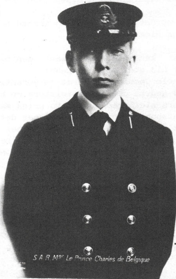
S. A. R. M gr Le Prince Charles de Belgique