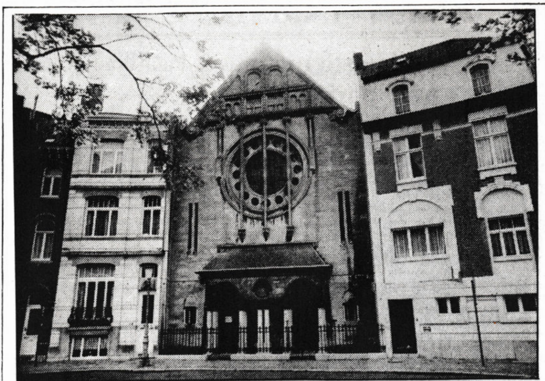
De achtergevel van de naar het oosten gerichte synagoge aan het Filip Van Maestrichtplein te Oostende. Midden in de gevel een fraai brandglasraam met het zegel van Salomon dat gedempt licht verspreidt in het romaanse interieur. Wegens de hoge onderhoudskosten heeft de Israëlitische gemeenschap het gebouw destijds afgestaan aan de stad. N° 11.06.1996