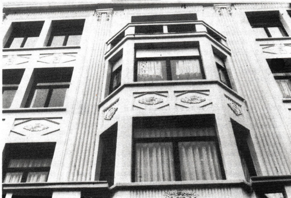
Christinastraat ingang Ensorgaanderij "Art Deco"

Wat zijn nu die Art Nouveau en Art Déco ?