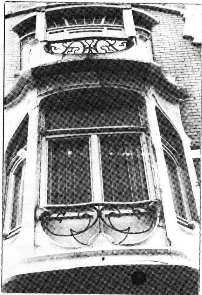
Kapellestraat 72B "Art Nouveau"

Een aantal van deze monsterprojecten kregen geen grond onder de voeten dankzij de akties van wakkere burgers en hun kulturele verenigingen.