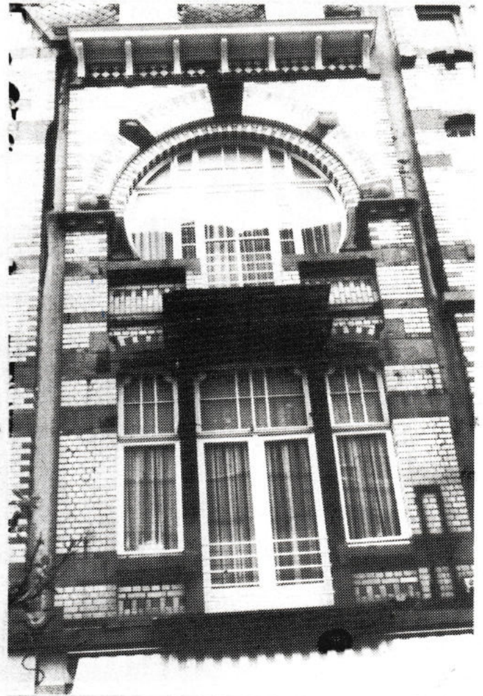
A. Buylstraat 26-34 Architect Pil "Art Nouveau"

Vanuit Nederland duikt vanaf 1925 de meest moderne architectuur op, namelijk de "nieuwe zakelijkheid". Koel, strak van lijnen, rationeel krijgt de baksteen een voorname rol te vervullen, zowel door kleur, vorm als baksteenverband. De gekende blok- of kozijnramen blijven in de Nederlandse traditie.