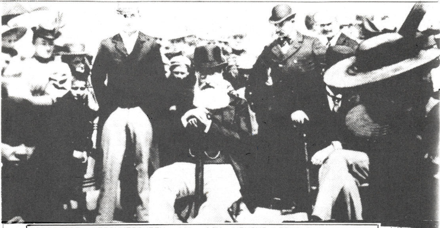
OOSTENDSE HERINNERINGEN (*) AAN KONING LEOPOLD II EN ZIJN REGERPERIODE.