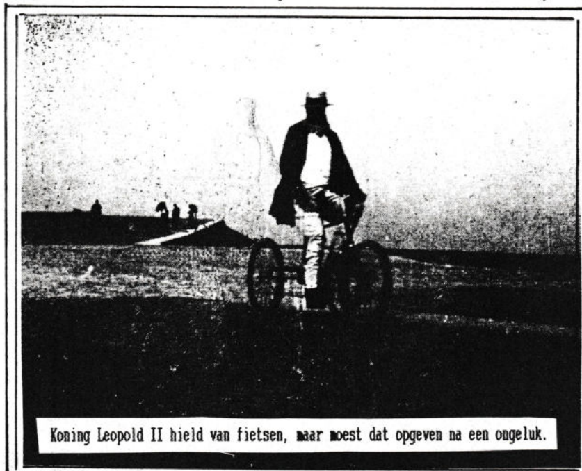
Koning Leopold II hield van fietsen, maar moest dat opgeven na een ongeluk.

(*) Ook in het Heemkundig Museum bevindt zich een Leopold II-buste. Dit zijn allemaal replica van de officiële portretbuste gemaakt door Thomas Vinçotte (zie De Plate, jan. 1986 p.9))