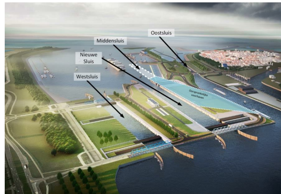
Figuur 2: Nieuwe indeling van het Terneuzen sluiscomplex.