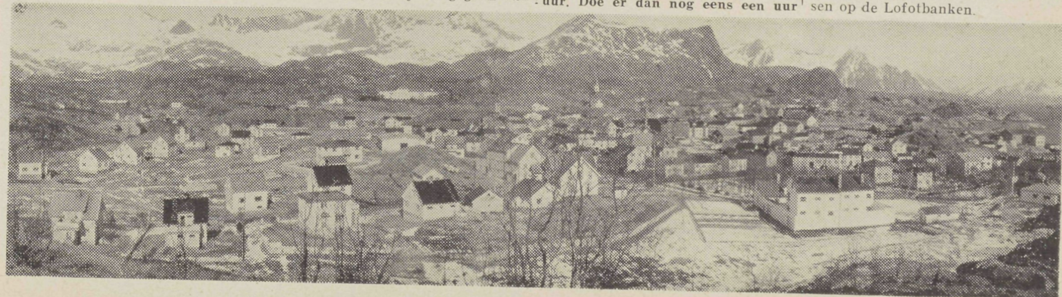
Alleen in 't Noorden vindt men dergelijke typische vissersdorpen

De tijd van zeeslagen tussen de met lijnen vissende Noordlanders en de met netten vissende Zuidlanders is allang voorbij. Er komen ook geen oorlogen meer voor tussen de trawlers en de anderen. Want sedert 1936 mogen in het belang van de handhaving van de kabeljauwstand geen trawlers meer vissen op de Lofotbanken.