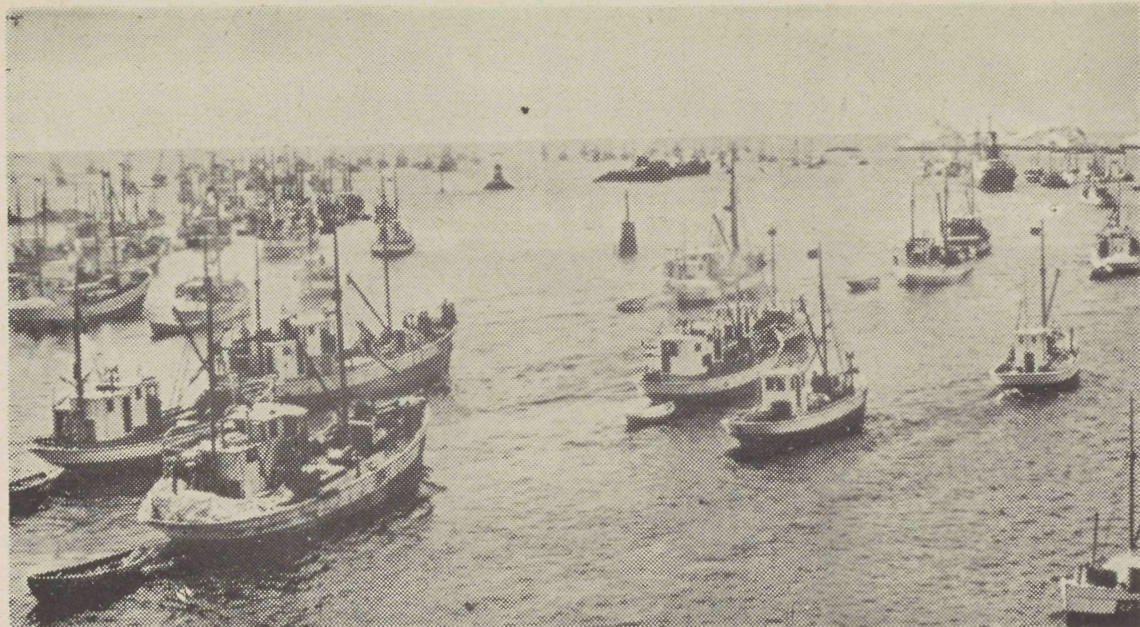
De haringvloot vaart uit

Het inpakken wordt door vrouwen gedaan, die nu eens niet een hele lange werkdag aan een paktafel behoeven te staan, maar rustig op moderne draaibare stoelen kunnen blijven zitten.