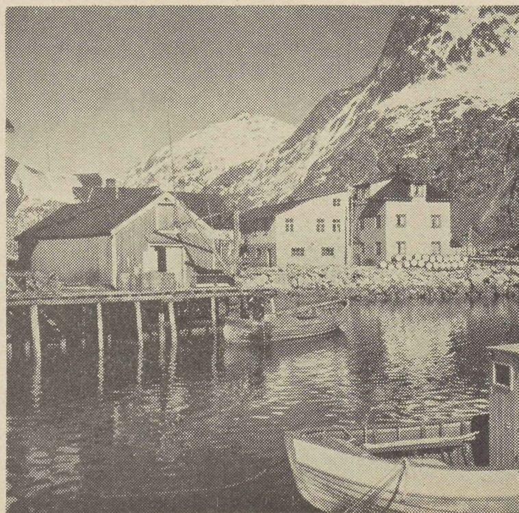
Lijkt dit niet een oud tafereel ?