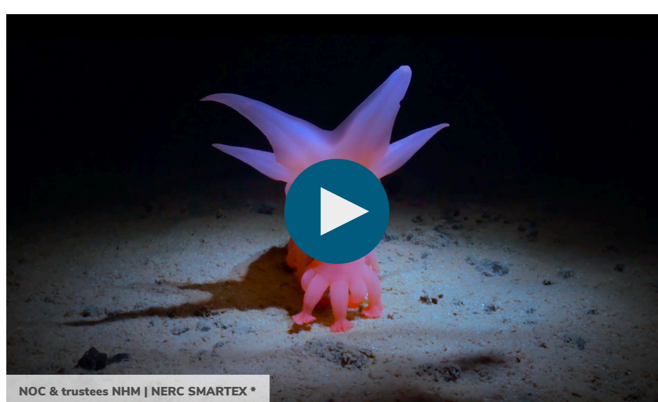
NOC & trustees NHM | NERC SMARTX*