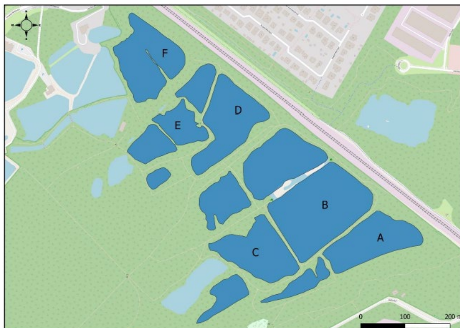
figuur 2.3 Benaming van de Kleiputten van Walenhoek.

Voor het presenteren van de bestandschattingen zijn de gevangen vissoorten ingedeeld in ecologische groepen en gilden.