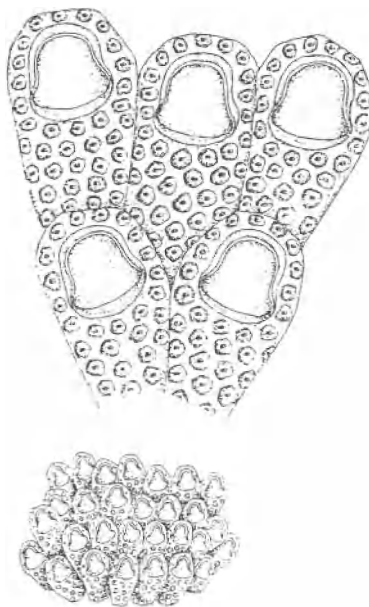
Fig. 1. Cryptosula pallasiana

Alle figuren naar A. Occhipinti Ambrogi, 1986.