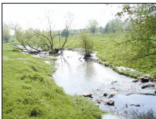
Figuur 4: Nevengeul op de Kleine Gete in Eliksem

Een voorbeeld van een technische oplossing is de v-vormige bekkentrap op de Kleine Nete in Herentals. Deze werd aangelegd op de linkeroever langs de stuw en werd ontworpen voor een groot aandeel van het debiet (min debiet tot 1.1 \text{ m}^3/\text{s} ). De uitstroom is heel goed gelocaliseerd ten opzicht van de stuw. Daarnaast gaat ze haaks in op de hoofdstroom. Het ontwerp van de bekkens en drempels zijn afgestemd op de zwakke zwemmers door snelheden te beperken tot maximaal 1 \text{ m/s} over de drempels. Daarnaast ontstaat door de v-vorm en het gebruik van stenen een grote diversiteit aan stroomsnelheden wat gunstig is voor de passeerbaarheid. De stenen werden voor 1/3^{\text{de}} vastgelegd met colloidaal beton, hierdoor blijft de grillige vorm van de stenen behouden. Over de drempel wordt de energie optimaal gedempt door rekening te houden met een verdrinkingsgraad van 0.5 over de drempel en door de bekkens voldoende lang en diep te maken. Ten opzichte van natuurlijkere oplossingen was het heel belangrijk dat de uitvoering nauwkeurig volgens het plan werd gerealiseerd.