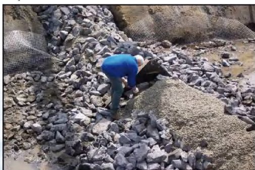
Figuur 5: Aanleg van stenen drempels in de v-vormige bekkentrap op de Kleine Nete in Herentals

Gerard P., 1912 Die Fishwege Handbuch der Ingenieurwissenschaften 3