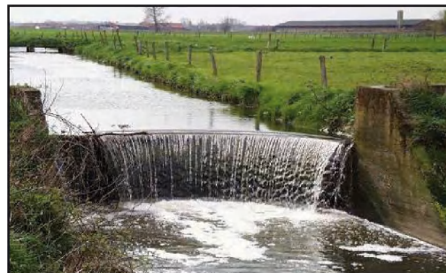
Figuur 1: migratieknelpunt voor de stroomopwaartse migratie

paai-gebieden vindt is nog onduidelijk. De zeeforel en de geherintroduceerde zalm zwemmen de Maas op, richting bovenstroomse paaihabitatten. De route is echter nog niet volledig opengemaakt. Bot, spiering en rivierprik zijn voorbeelden van grote migratoren die volgens de Rode Lijst onder de categorie 'zeldzaam' vallen. De paling ten slotte, die destijds zo talrijk was in onze waterlopen, is de laatste jaren sterk achteruitgegaan.