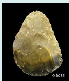
Paleolithische vuistbijl (ong. 100.000 jaar oud) opgevist voor de zuidkust van Engeland.