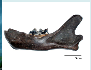
Onderkaak van een grottenleeuw afkomstig uit de Eurogeul. De kaak stamt uit de laatste ijstijd en is tussen de 20.000 en 50.000 jaar oud.