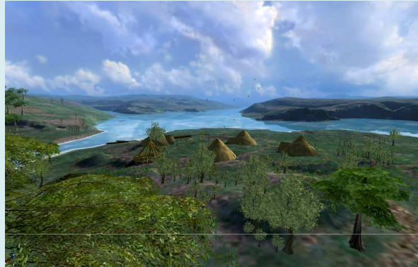
Een impressie van hoe het verdwenen landschap in de Noordzee er uit kan gezien hebben omstreeks 10.000 jaar geleden.

Vandaag liggen deze oude landschappen begraven onder de zeebodem. Veel landschappen zijn bewaard gebleven met inbegrip van de archaeologische artefacten zoals hout, bot - en plantenresten.