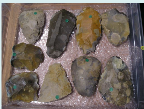
Paleolithische werktuigen opgevist uit de zuidelijke Noordzee.