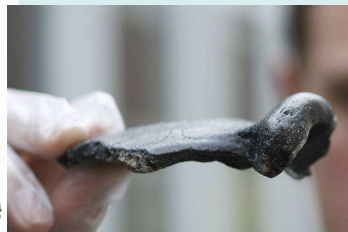
Neanderthaler schedelfragment gevonden voor de Zeeuwse kust. De dikke wenkbrauwboog, typisch voor Neanderthalers, is goed te zien.