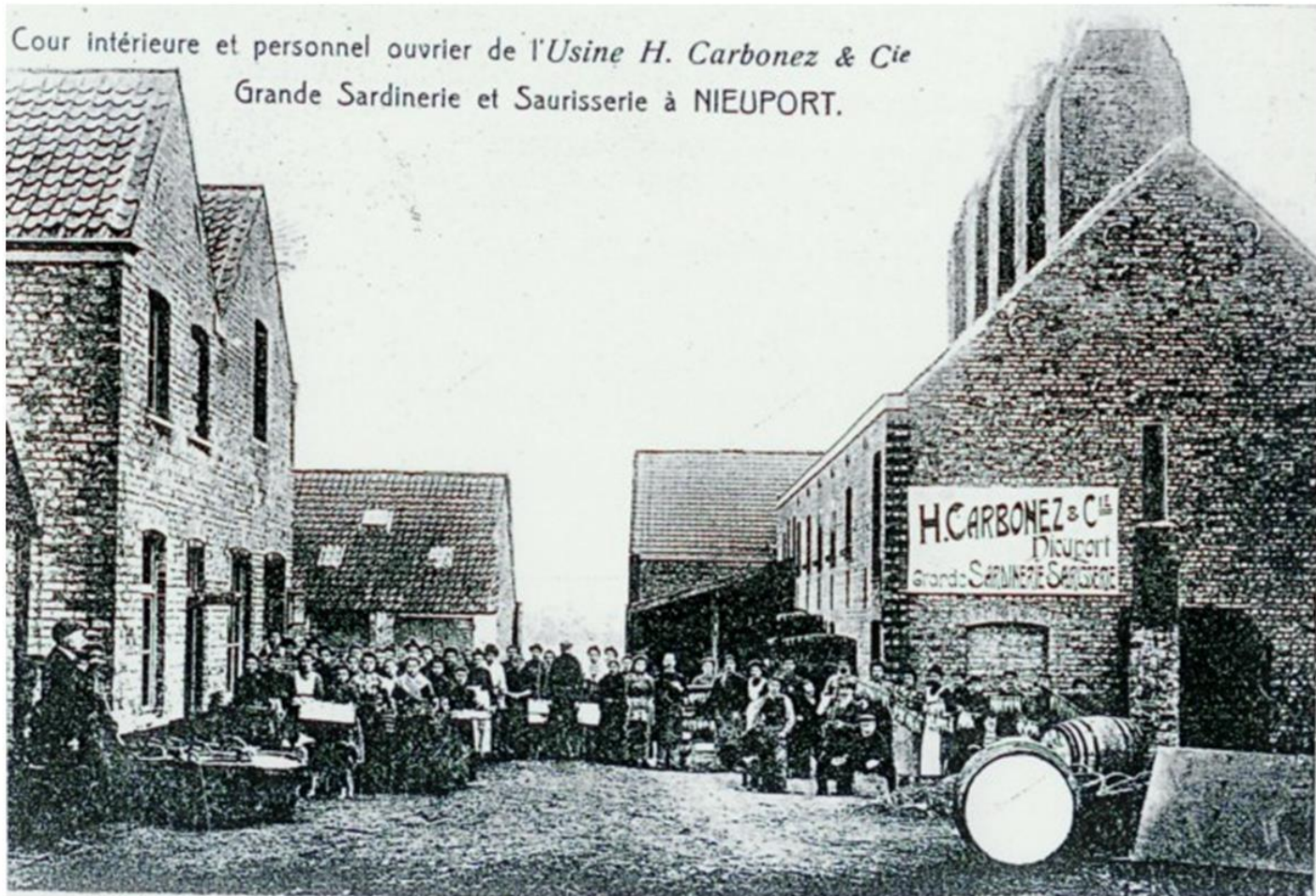
Personeel rokerij Crombez.

Cour intérieure et personnel ouvrier de l'Usine H. Carbonez & Cie Grande Sardinerie et Saurisserie à NIEUPORT.