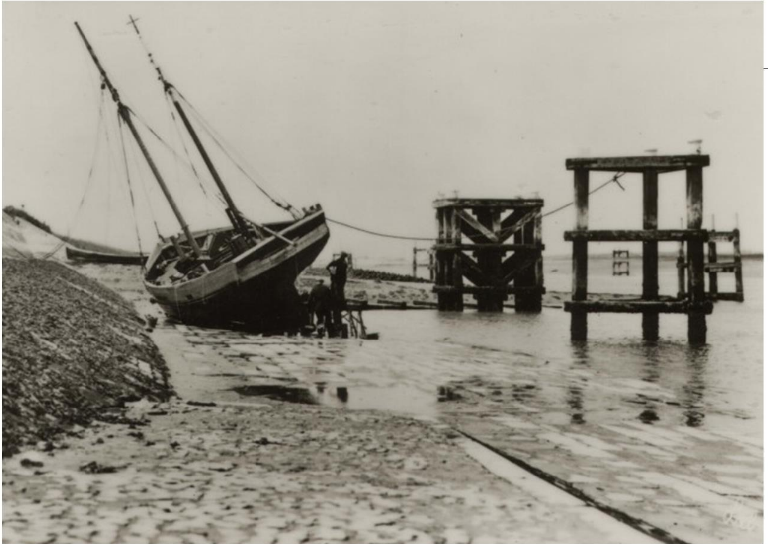
Schip op kuisbank Nieuwpoort