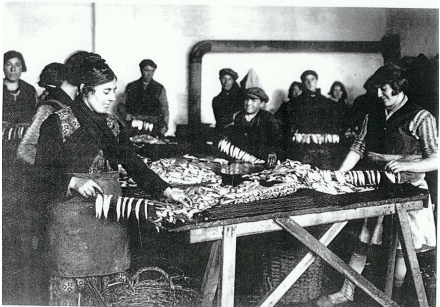
'Sprot opsteken' (collectie D. Moeyaert)