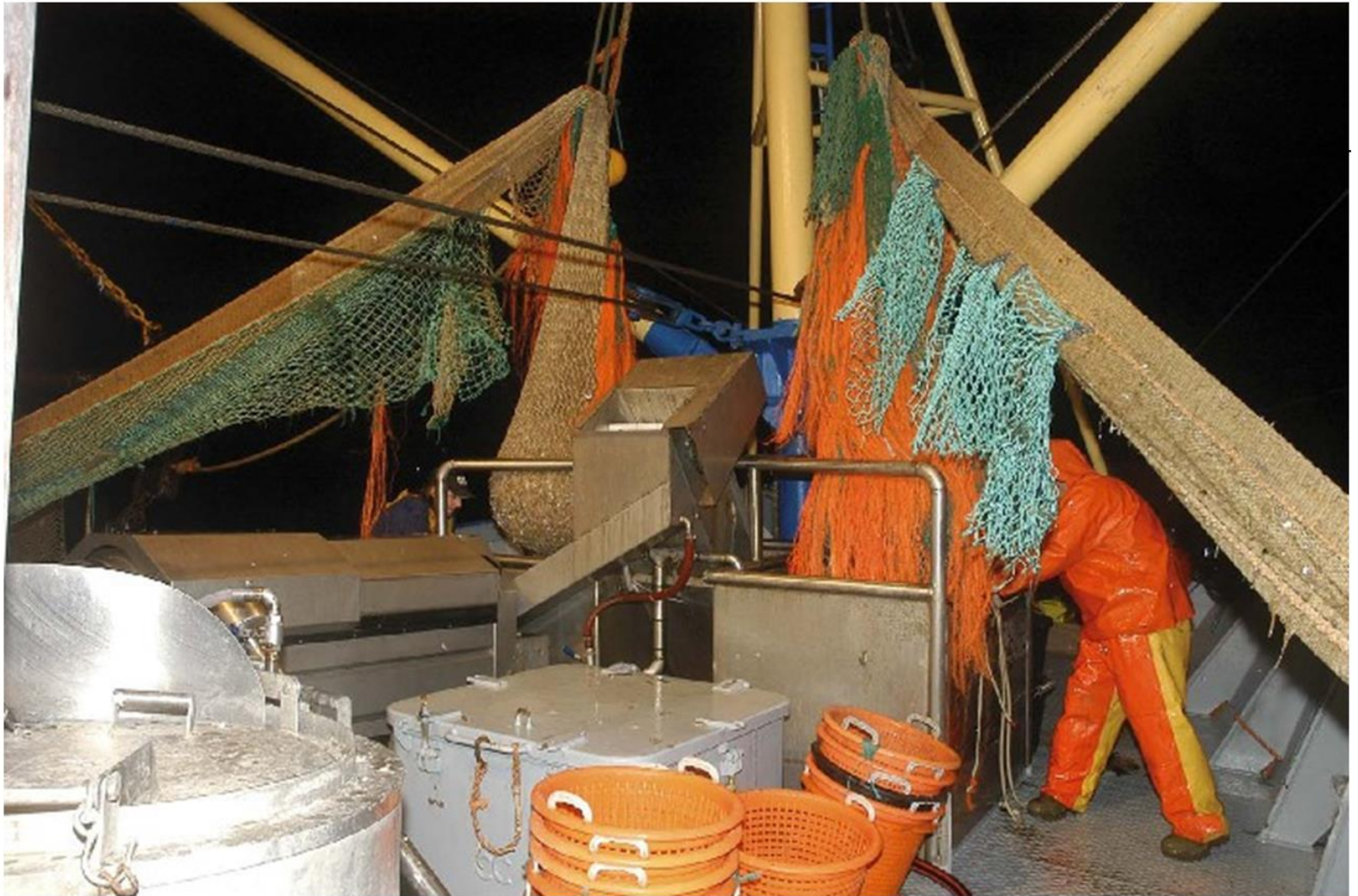
De garnaalvisser N86 'Surcouf' haalt de netten binnen voor de Nieuwpoortse kust.